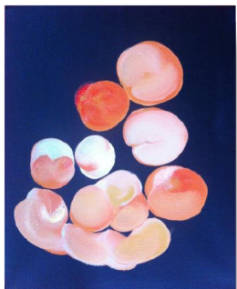
Boules Univers 1 , huile sur toile, 50cm x 40cm, 2017.