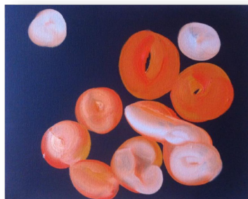
Boules Univers 2 , huile sur toile, 40cm x 50cm, 2017.