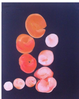
Boules Univers 10 , huile sur toile, 50cm x 40cm, 2017.