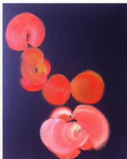
Boules Univers 9 , huile sur toile, 50cm x 40cm, 2017.