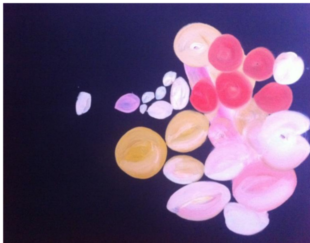
Estelle Jouili, Boules Univers 6 , 2017, Huile sur toile, 70 x 60.